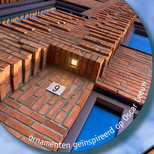
ornamenten geïnspireerd op Oscar Leeuw

Hart van de Waalsprong is het nieuwe centrumgebied voor Nijmegen Noord waar winkelen, een mix van woningtypologieën en publieke voorzieningen samengaan. Gebouwen en publieke ruimte zijn klimaat-adaptief en natuurinclusief ontworpen met verholten en zichtbare nestkasten. Robuuste bouwblokken, een zorgvuldige afstemming van materialen over het hele plangebied en rijke metselwerkdetailering dragen bij aan een karakteristiek stadsdeel met een sterke samenhang.