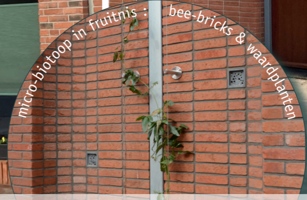
micro-biotop in fruitnis : bee-bricks & waardplanten