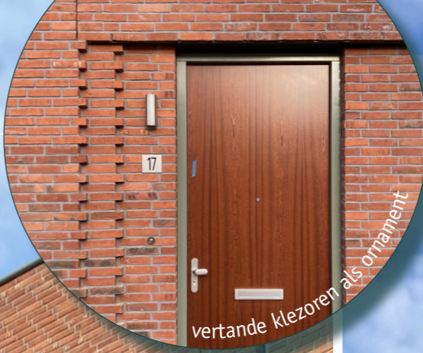
vertande klezoren als ornament

Hart van de Waalsprong is het nieuwe centrumgebied voor Nijmegen Noord waar winkelen, een mix van woningtypologieën en publieke voorzieningen samengaan. Gebouwen en publieke ruimte zijn klimaat-adaptief en natuurinclusief ontworpen met verholten en zichtbare nestkasten. Robuuste bouwblokken, een zorgvuldige afstemming van materialen over het hele plangebied en rijke metselwerkdetailering dragen bij aan een karakteristiek stadsdeel met een sterke samenhang.