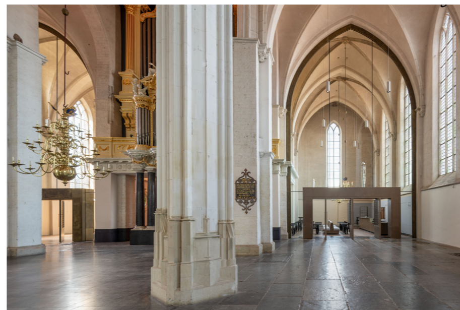
Situatie ná de herinrichting. De symmetrische vormgeving wordt verfijnd door verscheidenheid in materiaal, foto: Thea van den Heuvel.

De Stevenskerk is 750 jaar oud cultureel erfgoed in het hart van de stad, en de herinrichting van de kapellen maakt een nog diverser gebruik in de toekomst mogelijk: concerten, exposities en lezingen in de zuiderkapel, vieren en ontmoeten in de noorderkapel. Nieuwe vloer- en luchtverwarming in de kapellen breidt het gebruik van de kerk uit naar de wintermaanden waarin de kerk voorheen gesloten was. Het materiaal van de oude wanden is hergebruikt voor de nieuwe vloeren en restauraties in de kapellen en draagt zo bij aan een intieme sfeer. Kortom, een thuis voor alle Nijmegenaren!