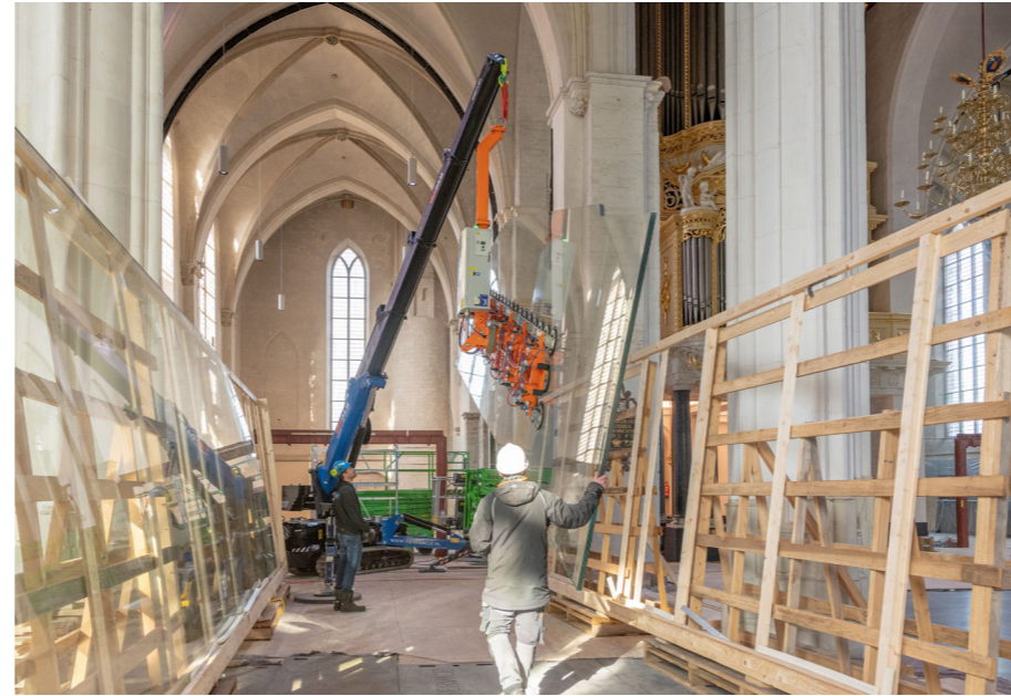
De plaatsing van de ultraheldere glaspanelen van 2,7 x 10,7 meter groot en 2500 kilo zwaar, foto: Thea van den Heuvel. Klik voor een video!