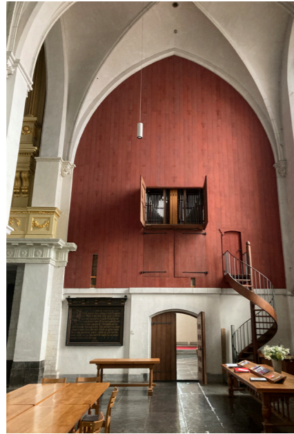
Situatie vóór de herinrichting, de noorderkapel (2021).