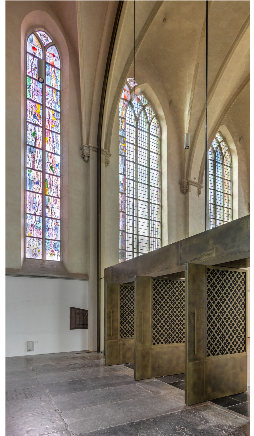
Nieuwe wand van de zuiderkapel. Het vlecht patroon in de deuren is geïnspireerd op het gotische vlechtwerk in de kooromgang, foto: Thea van den Heuvel.