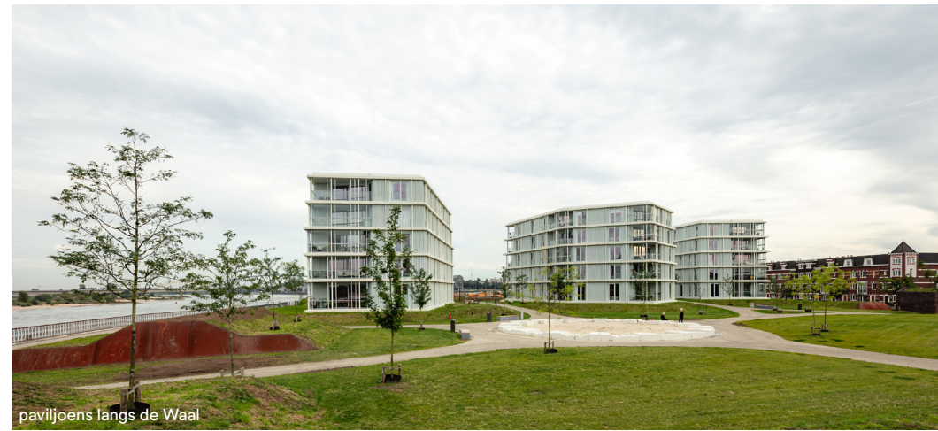
paviljoens langs de Waal

Kipstraat 52 3011 RT Rotterdam +31 10 2010405 info@orangearchitects.nl www.orangearchitects.nl