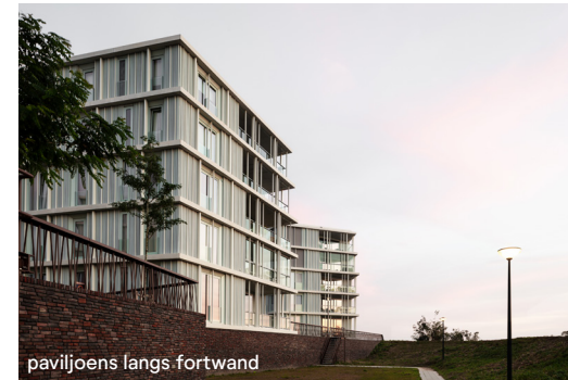
paviljoens langs fortwand