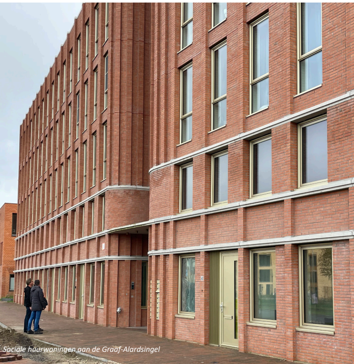
Sociale huurwoningen aan de Graaf-Alardsingel

Het oostelijke bouwblok met 30 eengezinswoningen laat een interessante compositie van het stadsblok zien met erkerwoningen die prachtig overhoeks de straat inkijken, 4-laagse starterswoningen met voortuintjes en dakterrassen, hofwoningen en stoere herenhuisen met een extra hoge beganegrond.