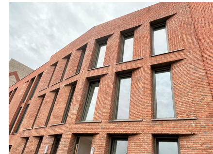
Herenhuis aan de Graaf-Alardsingel