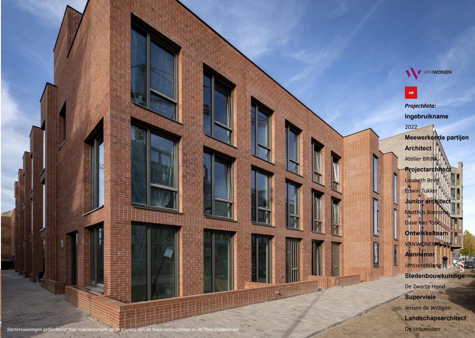
Starterswoningen geflankeerd door erkerwoningen op de kruising van de Truus Gelsingstraat en de Theo Dobbestraat